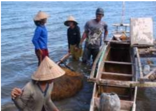
Gambar 7 Tenaga kerja wanita pembudidaya rumput laut yang bekerja di laut.

Beberapa tenaga kerja wanita di bidang pembudidayaan rumput laut bukan hanya bekerja disekitar area pantai, namun beberapa diantara mereka telah beralih ke arah laut.