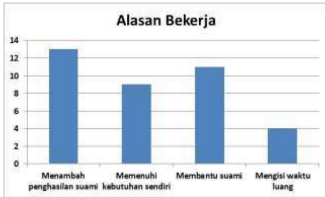
Gambar 9. Diagram alasan wanita bekerja

Table di atas memperlihatkan alasan yang tertinggi wanita bekerja adalah untuk menambah penghasilan keluarga Umumnya yang memiliki jawaban memenuhi kebutuhan sendiri dan mengisi waktu adalah wanita yang berusia 30 tahun ke bawah.