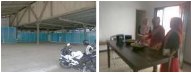
Gambar 4. Gudang dan Wanita yang bekerja di gudang pengolahan telur ikan terbang

Selain pekerjaan yang terkait dengan sector perikanan dan kelautan, ada beberapa wanita yang juga bekerja sampingan seperti jualan (warung kelonting) dan sayur mayor.