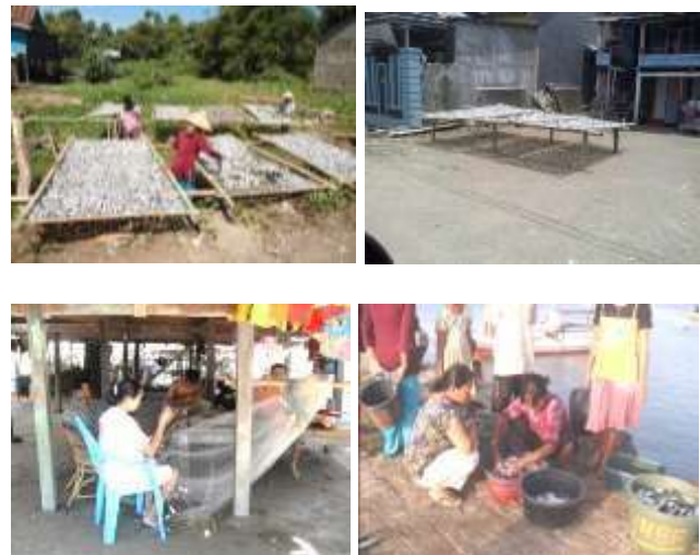
Gambar 3. Jenis pekerjaan yang dilakukan wanita nelayan

Saat ini terdapat lebih sekitar 10 tempat penjemuran ikan milik masyarakat. Rata-rata satu tempat penjemuran mempekerjakan sekitar 10 orang karyawan. Jumlah wanita antara usaha penjemuran bervariasi, ada dengan 5 orang wanita, ada juga 3 atau bahkan hampir semua tenaga kerjanya adalah wanita. Berikut gambar tenaga kerja wanita yang mengeringkan ikan, menjual ikan, dan membuat jala (alat tangkap ikan).