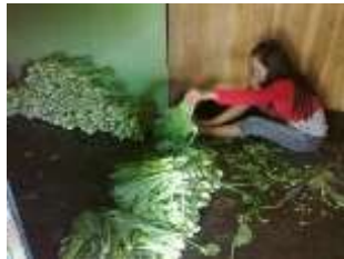
Gambar 5. Pekerjaan sampingan wanita selain di bidang perikanan

Selain pekerjaan yang terkait dengan sector perikanan dan kelautan, ada beberapa wanita yang juga bekerja sampingan seperti jualan (warung kelonting) dan sayur mayor.