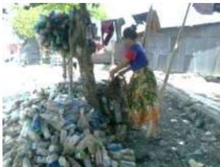
Gambar 2. Tempat kerja rumput laut

Rata-rata masyarakat membudidayakan rumput laut disekitar pantai. Ibu-ibu rumah tangga juga melakukan kerja di area pantai di belakang rumah mereka. Berikut gambar tenaga kerja wanita pembudidaya rumput laut.