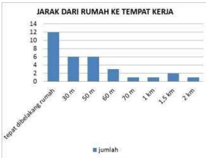
Gambar 1. Diagram jarak dari rumah ke tempat kerja

Jonggobatu (sumber dg. Sagala, Aeng Batu 2014). Berikut diagram yang memperlihatkan jarak dari rumah ke pantai yang merupakan lokasi kerja para wanita pembudidaya rumput laut.